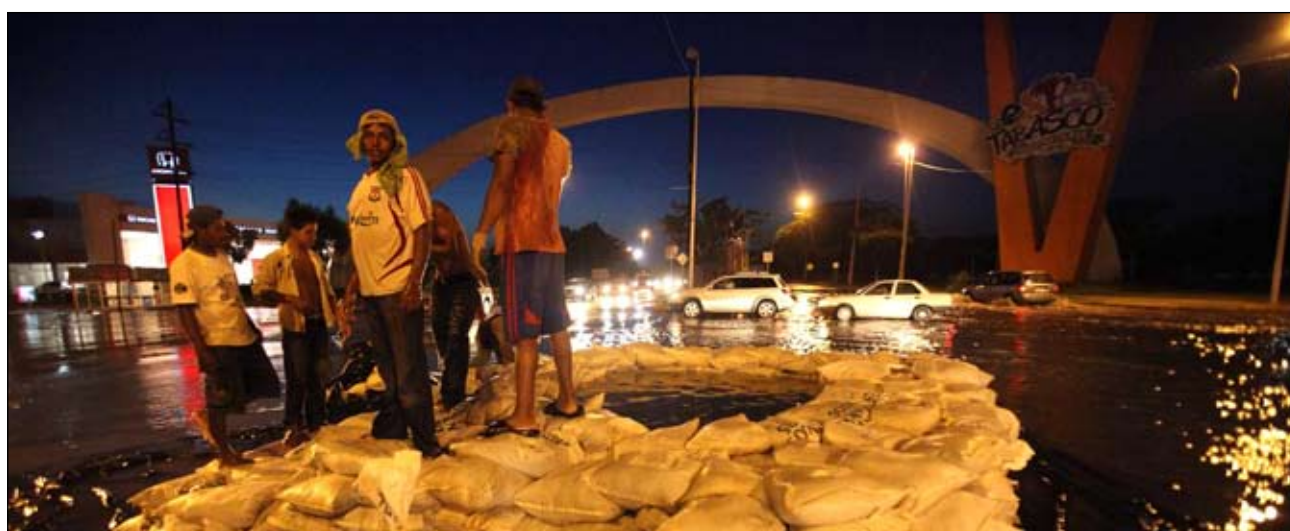
Cientos de habitantes de la capital tabasqueña aprovecharon que el mal tiempo dio una tregua y se organizaron masivamente para levantar murallas con costales llenos de arena, en un intento por contener las aguas de los ríos Samaria y Carrizal, que reciben el desfogue de las presas del Alto Grijalva: Angostura, Chicoasén, Malpaso y Peñitas, y que están a punto de desbordarse con el riesgo de inundar a Villahermosa y municipios aledaños. RML.

Refieren que al circular por el poblado de Salazar tres automóviles los rebasaron "a alta velocidad y sin precaución". Les marcaron el alto, les pidieron sus datos generales y uno respondió que era Édgar Valdez Villarreal.