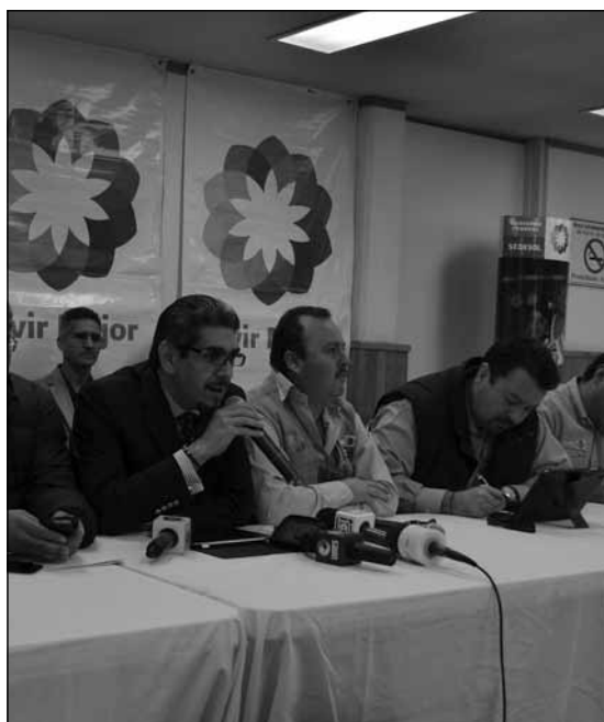
LAS ESTRATEGIAS DEL GOBIERNO FEDERAL

el 5 de febrero, sólo un día después que terminen las precampañas. El registro de los aspirantes a la candidatura presidencial será el 27 de noviembre y entre el 18 de diciembre y 4 febrero se realizarán las precampañas. Este es el trabajo que ya está poniendo en marcha el PRI, partido que además, ya estableció que irá en alianza con el Verde Ecologista y con el Panal.